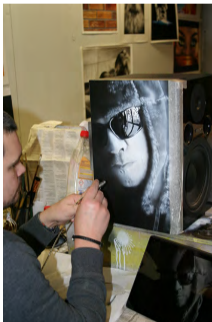
Peinture à l'aérographe sur enceinte audio