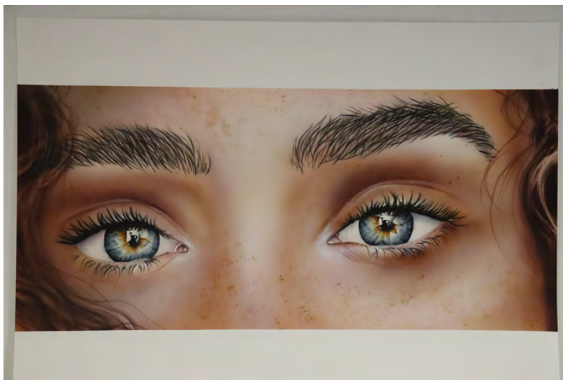
Module "le regard" à l'aérographe

Merci de nous contacter pour obtenir les dates complètes du planning (début, fin, congés)