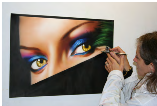
Module "le regard" à l'aérographe